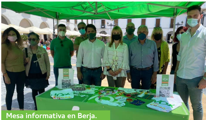
Mesa informativa en Berja.