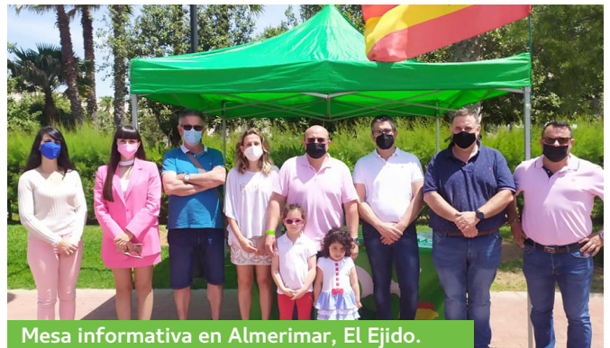
Mesa informativa en Almerimar, El Ejido.