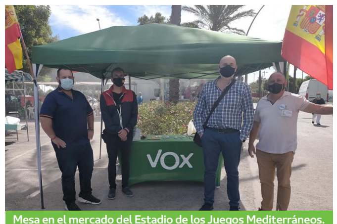
Mesa en el mercado del Estadio de los Juegos Mediterráneos.