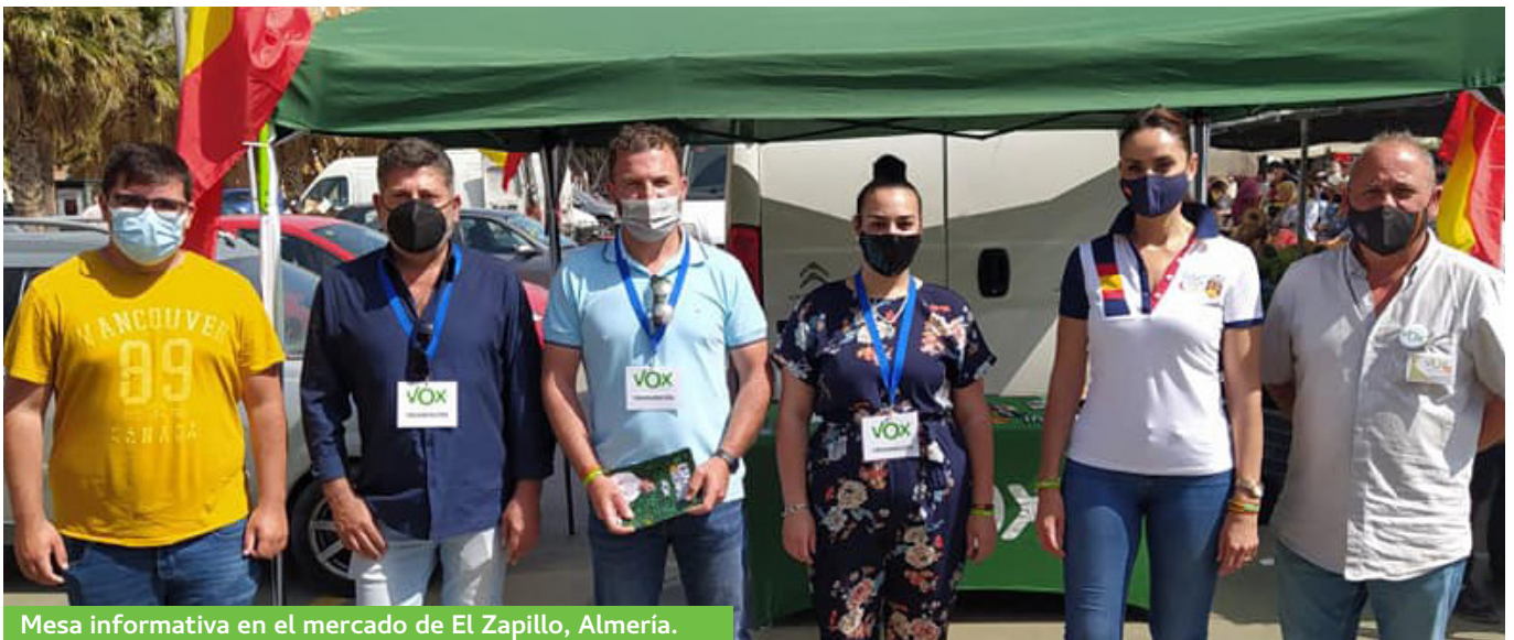
Mesa informativa en el mercado de El Zapillo, Almería.