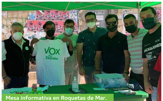
Mesa informativa en Roquetas de Mar.