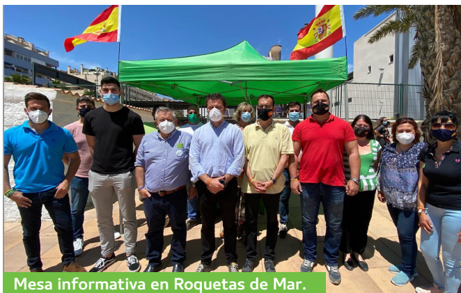
Mesa informativa en Roquetas de Mar.