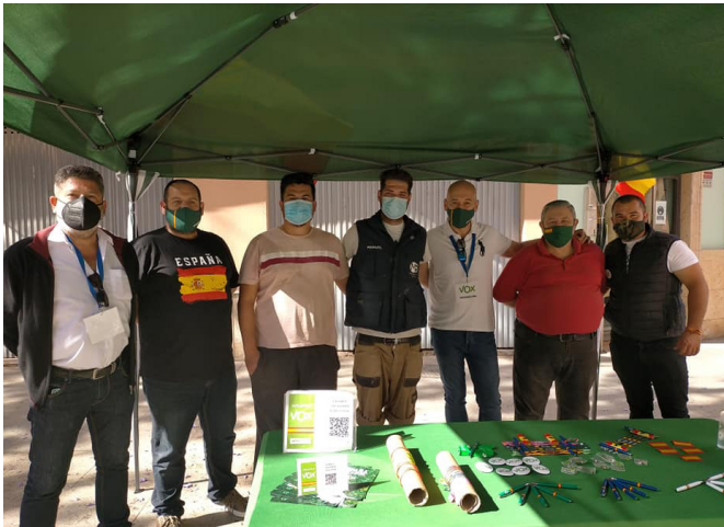
Mesa informativa en la Plaza de Altamira, Almería.

Nuestros equipos han estado compartiendo el proyecto de VOX por toda la provincia y sumando nuevos afiliados. ¡Seguimos adelante!