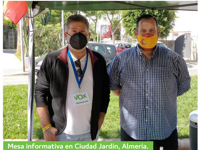
Mesa informativa en Ciudad Jardín, Almería.