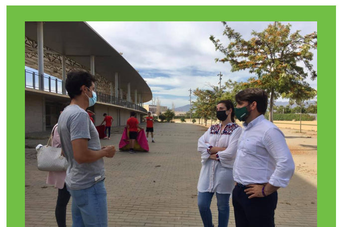
Hemos visitado la Escuela Taurina de Almería para mostrarles nuestro apoyo. VOX defiende a ultranza la tauromaquia como parte del patrimonio cultural de España.