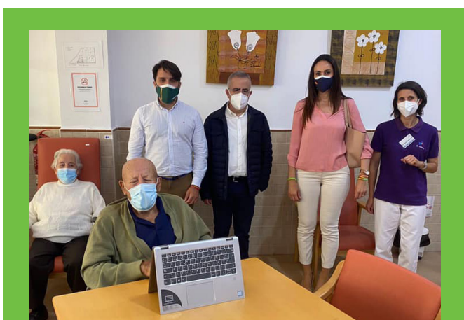
Hoy hemos visitado los centros de Asociación de Personas con Discapacidad El Saliente de Albox donde ayudan a las personas con discapacidad a tener una vida mejor.