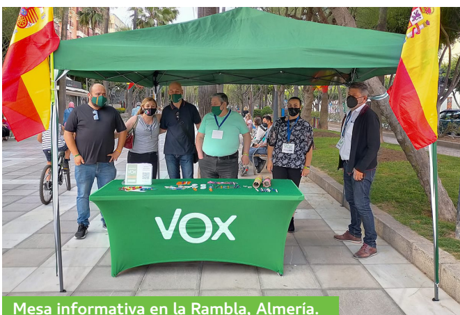
Mesa informativa en la Rambla, Almería.