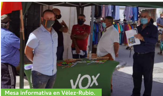
Mesa informativa en Vélez-Rubio.