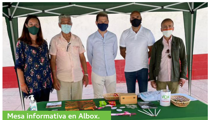
Mesa informativa en Albox.